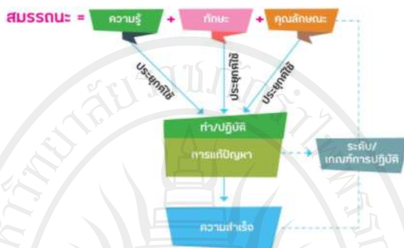
ภาพประกอบ 3 แสดงความสัมพันธ์ขององค์ประกอบของสมรรถนะ 7 องค์ประกอบ ที่มา : สำนักงานเลขาธิการการศึกษา กระทรวงศึกษาธิการ. 2562 ข : 11

จากกรอบแนวคิดเกี่ยวกับสมรรถนะ สรุปได้ว่า องค์ประกอบของสมรรถนะที่สำคัญ มี 7 ประการ ประกอบด้วย 1) ความรู้ (Knowledge) 2) ทักษะ (Skill) 3) คุณลักษณะ/ เจตคติ (Attribute / Attitude) 4) การประยุกต์ใช้ (Application) 5) การกระทำ / การปฏิบัติ (Performance) 6) งานและสถานการณ์ต่าง ๆ (Tasks / Jobs / Situations) 7) ผลสำเร็จ (Success) ตามเกณฑ์ที่กำหนด (Performance Criteria)