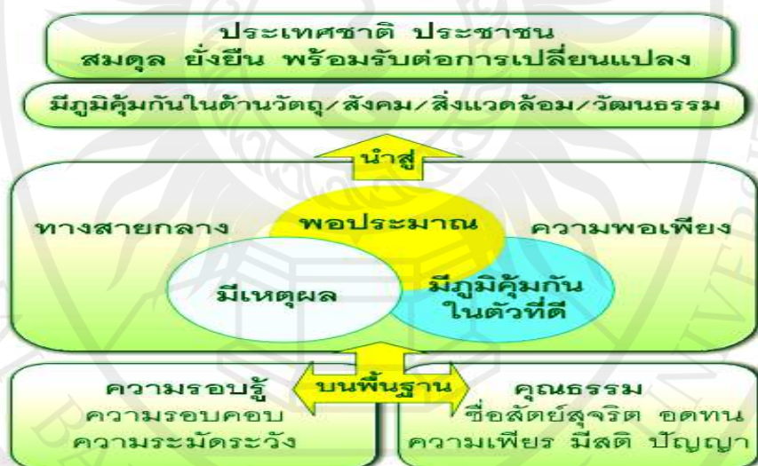
ภาพประกอบ 2 ปรัชญาของเศรษฐกิจพอเพียง