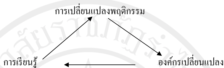
ภาพประกอบ 2 การเปลี่ยนแปลงพฤติกรรมองค์กร