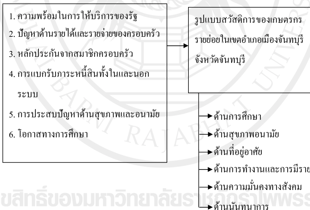
ภาพประกอบ 1 กรอบแนวคิดในการวิจัย